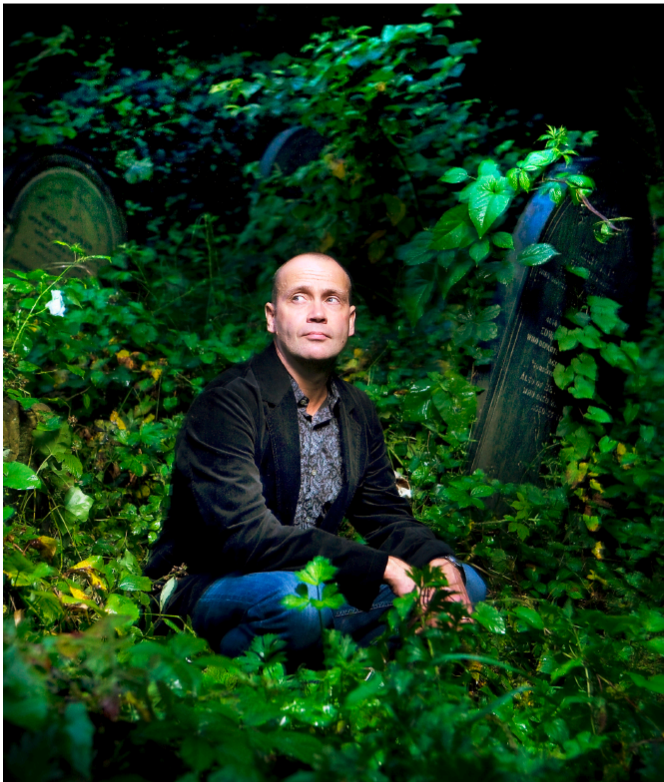
Wer «Verwesung» schreibt, muss Friedhöfe lieben: Bestsellerautor Simon Beckett.

Nicht unerheblich zum Erfolg beigetragen haben dürfte die Marketingstrategie des Rowohlt-Verlags. In der Schweiz, in Deutschland und Österreich erschienen die vier Hunter-Romane von Beginn an in schlichter Schwarzweiss-Optik. Dazu ein grafisch angedeutetes Kreuz - die reduzierte Symbolik hebt sich von den sonst oft grellen Covers mit grossen Buchstaben ab. Es ist wohl kein Zufall, dass dieser Gegenentwurf zum